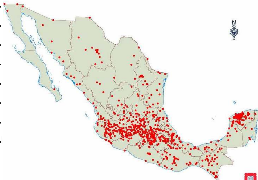
Distribución de sucursales de L@ Red de la Gente

• L@ Red de la Gente ELABORADO POR: DIRECCIÓN GENERAL ADJUNTA DE PLANEACIÓN ESTRATÉGICA Y EVALUACIÓN